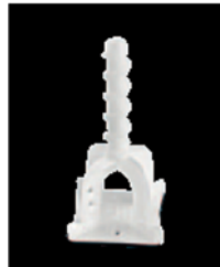
PRSC 2 PRSC 3