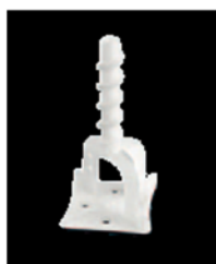
PRST 2 PRST 3