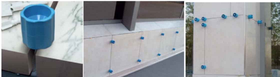
Linearno polaganje nivela

Okretanjem čepa može se nivelirati debljina do 40 mm s spojištem od 8 mm.