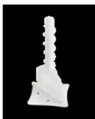
PRSL 1 PRSL 2 PRSL 3